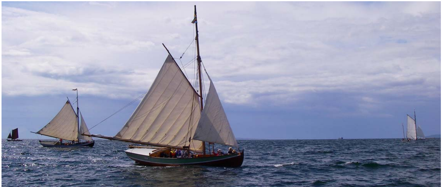
Stolte storbåde fra Ålandsøerne

Men bådene var der jo, fine storbåde fra Åland og Sverige, mange småjoller, mest fra nærmiljøet.