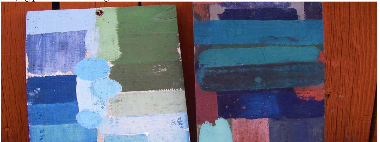
Mettes farveprøver har tilbragt 3 – 5 år udendørs

Vegetabilsk terpentin (fransk terpentin) er fint. Den bedste kvalitet hedder Balsamterpentin. - dette kan købes meget dyrt, eller håndhentes i Sverige. Mal altid i mange, tynde lag. Det blir bedst sådan. Jeg køber materialerne hos Claesson i Gøteborg. I store portioner, så er der til os alle, og prisen blir fornuftig.