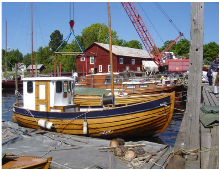
Saxemaraværftets lille havn