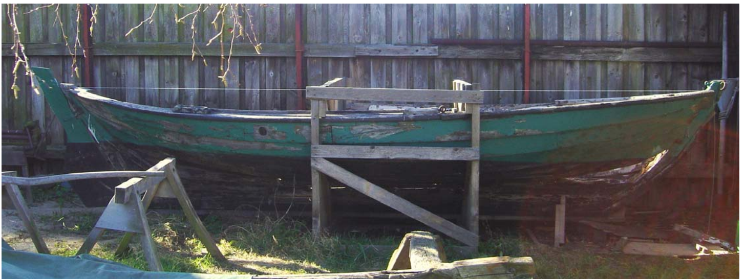
”Jonna” den ældre