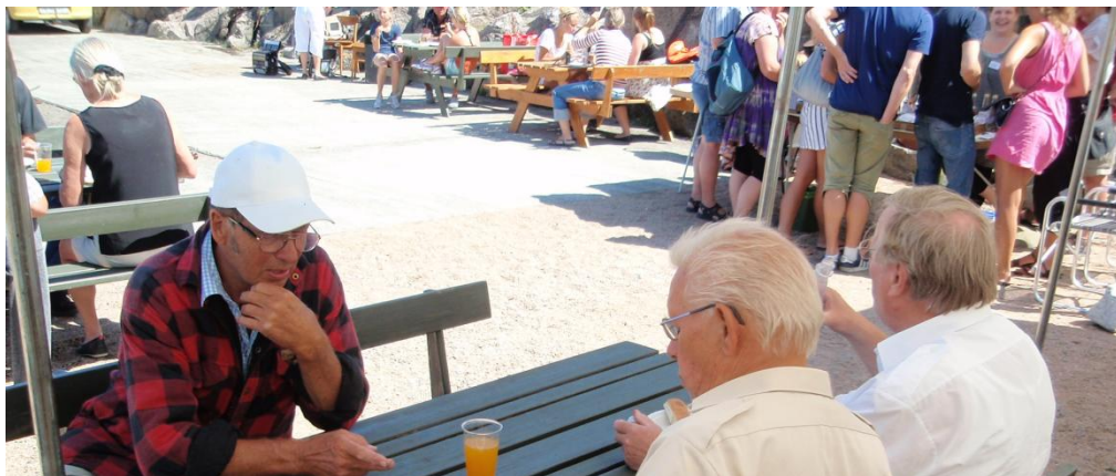
Tre af foreningens medlemmer diskuterer om en citronvand nu også er helt appelsinfri.

Bornholms Snapselaug udskænkede smagsprøver og musik og råhygge fortsatte til langt ud på aftenen.