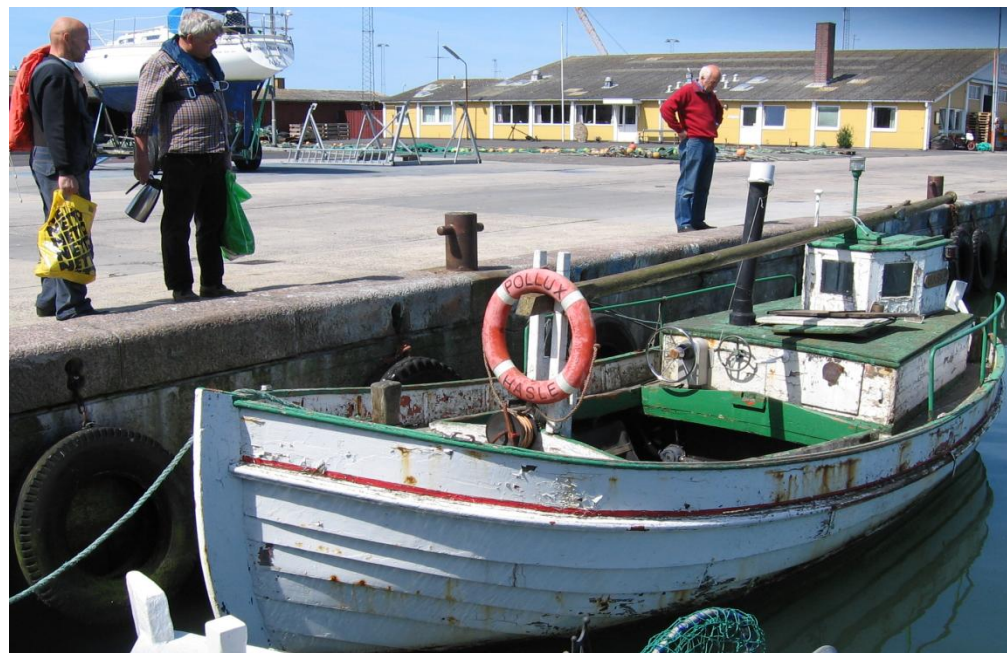
Mogens til Lars: Skal vi hellere tage på skovtur med kaffen og kringlerne?